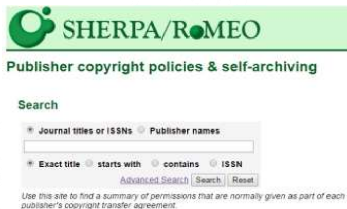
Rys 2. Wyszukiwanie proste

Z bazy można korzystać bezpłatnie, jest dostępna pod adresem http://www.sherpa.ac.uk/romeo/index.php . Jedynym ograniczeniem może być bariera językowa, gdyż baza jest w języku angielskim.