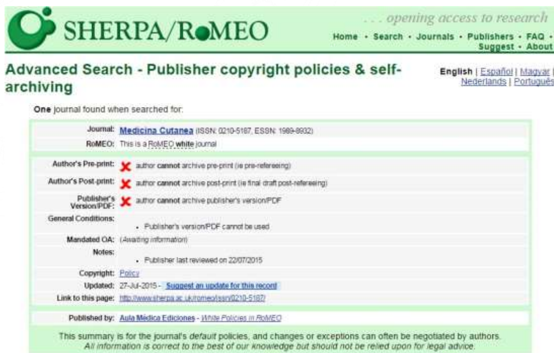
Rys 9. Przykład czasopisma oznaczonego kolorem białym, tj. prowadzącego zamkniętą politykę udostępniania źródło: serwis RoMEO, http://www.sherpa.ac.uk/romeo/issn/1507-7187/

Ostatnia kategoria kolorów to białe czasopisma – w nich wydawcy mają najbardziej restrykcyjną politykę i nie wyrażają zgody na archiwizację pre-printów, post-printów czy plików wydawcy.