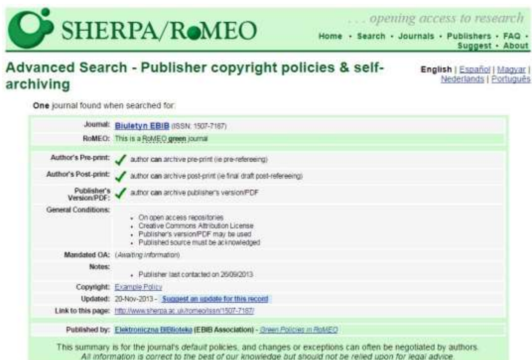
Rys 6. Przykład czasopisma oznaczonego kolorem zielonym, tj. prowadzącego otwartą politykę udostępniania źródło: serwis RoMEO, http://www.sherpa.ac.uk/romeo/issn/1507-7187/

Zielone czasopisma w interpretacji RoMEO są najbardziej otwarte, korzystają nierzadko z licencji CC, pozwalają na umieszczanie każdej publikacji, czy to w wersji autorskiej, czy w pliku wydawcy, w otwartych repozytoriach czy na innych stronach internetowych – zazwyczaj wystarczy podać link do źródła i autorstwo tekstu. Kolor ten oznacza też, że wydawca wyraża zgodę na upublicznienie tekstu jeszcze przed jego opublikowaniem w czasopiśmie. Wszelkie dodatkowe uwagi do co polityki danego wydawnictwa zawarte są w zakładce General Conditions.